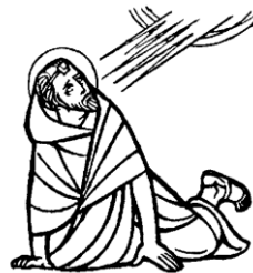
CONVERSIONE DI SAN PAOLO

Thánh Phaolô khi bắt đầu rao giảng là chỉ có Đức Kitô mới cứu chuộc được chúng ta. Ngài từng là người Pharisiêu hơn ai hết, trung thành với luật Môisen hơn ai hết. Nhưng bây giờ bỗng dưng ngài xuất hiện trước các người Do Thái như một người lạc giáo của Dân Ngoại, một kẻ phản bội và chối đạo.